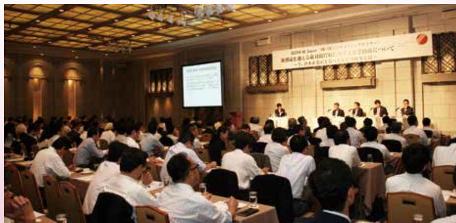
2016年9月21日開催IR・SRコンサルティングセミナー：「新潮流を迎える敵対的買収に対する企業防衛について～今、日本企業がとるべき企業防衛策とは～」