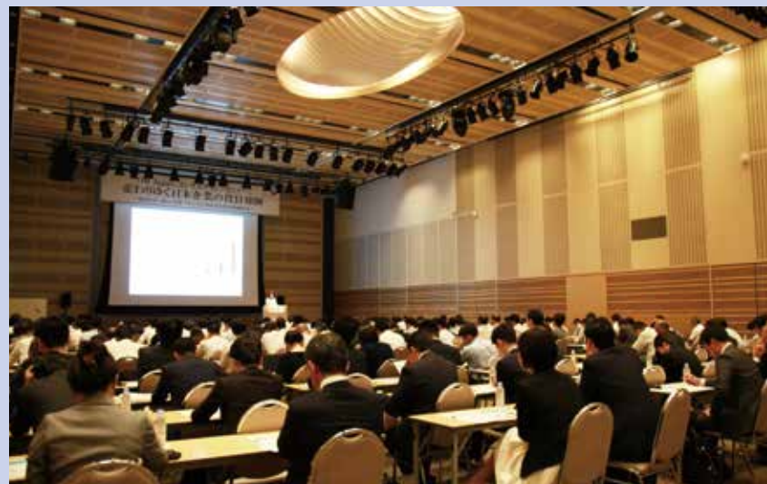
2016年7月27日開催IR・SRコンサルティングセミナー：「変わりゆく日本企業の役員報酬～攻めのコーポレート・ガバナンスに対応する役員報酬改革～」