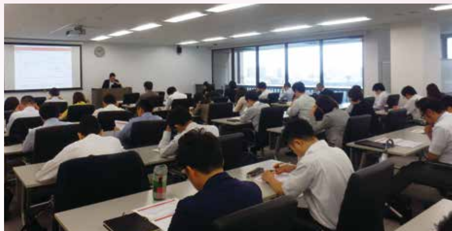
2016年9月開催実務者向けセミナー：「個人株主との対話と新しい個人株主の管理に向けて」

このような現状を踏まえ、IR Japanでは2016年9月に「個人株主との対話と新しい個人株主の管理に向けて」と題した実務者向けのセミナーと、「新潮流を迎える敵対的買収に対する企業防衛について～今、日本企業がとるべき企業防衛策とは～」と題した第21回となるIR・SRコンサルティングセミナーを開催いたしました。両セミナーとも多数のご来場を賜りました。IR・SRコンサルティングセミナーは2部構成で行い、第1部では「近年の敵対的買収者とその戦略について」と題した講演、第2部では、「新しい敵対的買収者を見据えた日本企業のとるべきアクションとは」という内容で政府関係者や大学院教授、弁護士をパネリストとしてお迎えし、新たな買収防衛策の可能性について活発な意見交換を行いました。