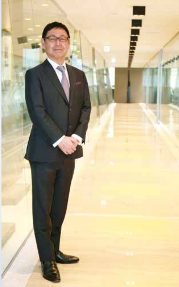
代表取締役社長・CEO