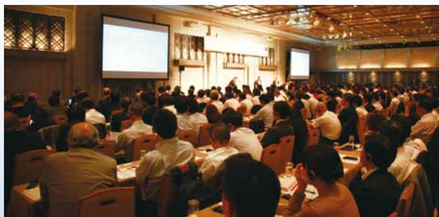
2015年9月30日開催：欧州最大手SWF:Norges Bank Investment Management 日本株投資・議決権行使に関する講演