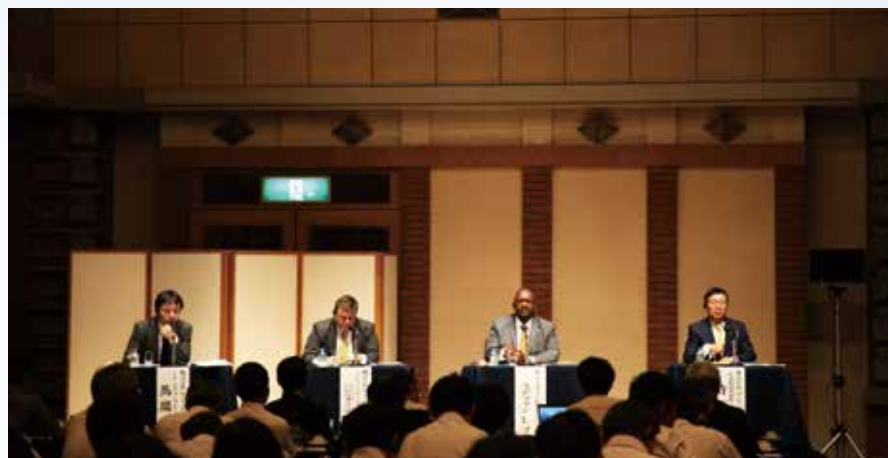
2015年7月17日開催：外国人株主との対話・取締役会評価に関する緊急特別セミナー

また、今年で19回目となるIR・SRコンサルティングセミナーでは、欧州最大手のSWF:Norges Bank Investment Managementをお招きし、「日本株投資・議決権行使に関する講演」として2015年9月30日（水）に開催いたしました。第1部では「Norges Bankの議決権行使・日本株投資の考え方について」、第2部では「コーポレートガバナンス・コードと日本企業の今後の対応について留意すべきこと」という内容にて米国・日本を代表する最大級の機関株主ならびに、政府関係者をパネリストとしてお招きし、活発な意見交換を行いました。